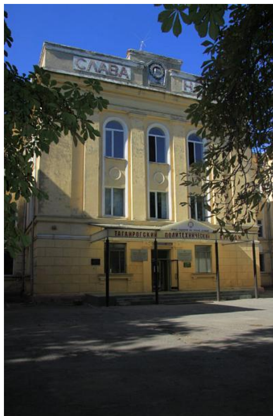
Таганрогский политехнический институт, филиал Донского государственного университета